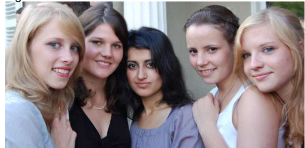
Die Teilnehmerinnen bedauerten, dass die Woche nun schon vorüber war....