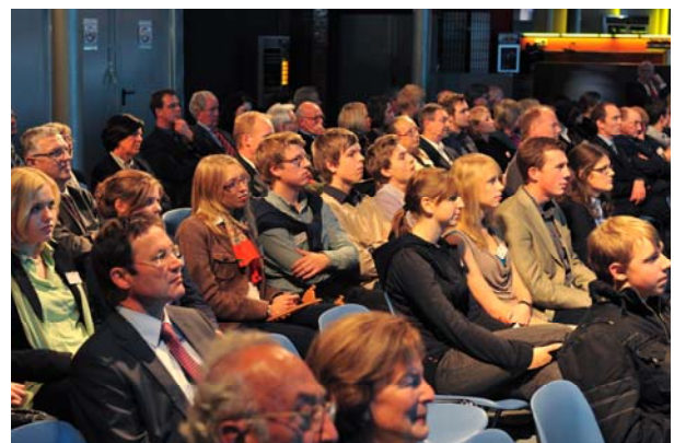
Im Publikum waren sowohl Manager/innen als auch Auszubildende und Schüler/innen vertreten.