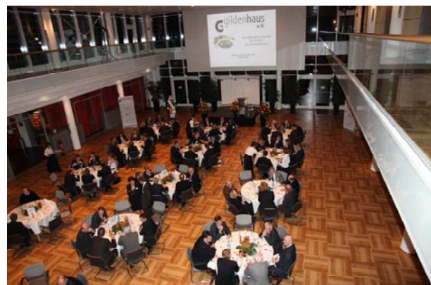
180 Gäste aus vielen Bereichen des gesellschaftlichen Lebens nutzten den Abend, um dem Redner zu lauschen und Kontakte zu knüpfen.