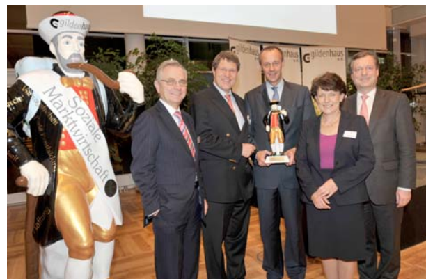
Immer dabei: der Gildenhaus e.V. - Leineweber, der das Anliegen des Vereins Gildenhaus e.V. verkörpert: Werbung für die soziale Marktwirtschaft.