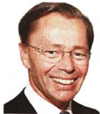
Eloquent: Manager Thomas Middelhoff.

Aus dem Unternehmensmanager Middelhoff ist jetzt wieder