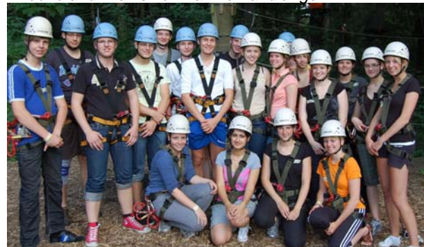
„Gemeinsames Klettern fördert die Teambildung“ meinten die Veranstalter. Die Teilnehmerinnen und Teilnehmer zeigten sich begeistert nachdem sie anfängliche Bedenken überwunden hatten.