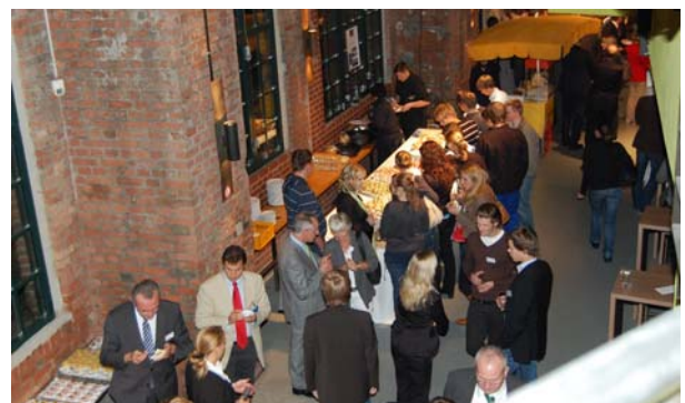
Büffet zum Thema „60 Jahre Marktwirtschaft“.