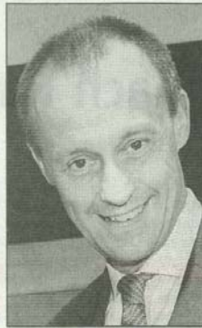
Finanzexperte Friedrich Merz.

Außer zu den Folgen der Weltwirtschaftskrise, die noch lange nicht überwunden seien, äußerte sich Merz auch zur Bildungspolitik. Wie immer