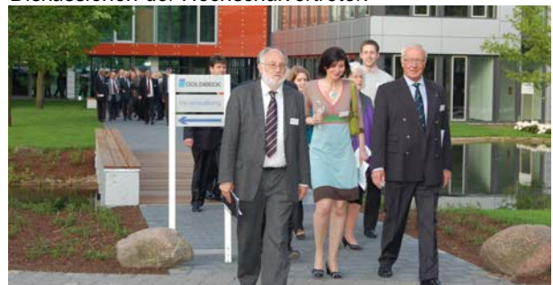
Die Gäste wechseln nach dem Empfang vom Foyer des GoBa – Zentrums in das Goldbeck-Kasino.