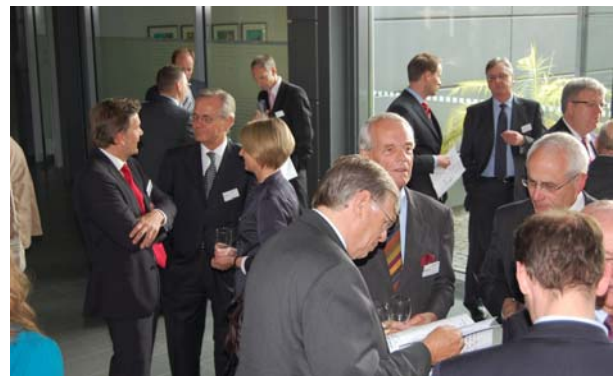
Anregende Gespräche im Foyer der Fa. Goldbeck.