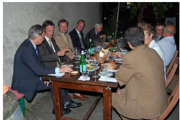
Informelle Gespräche finden nach der Mitgliederversammlung im Restaurant Jivino statt.