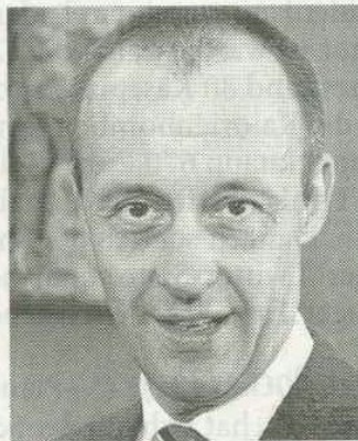
Kam zum Grünkohlessen: Ex-CDU-Politiker Friedrich Merz.

Die Zukunftsfähigkeit der Gesellschaft, so der Jurist, Politiker und Buchautor, bleibe untrennbar mit der Bildungsfrage ver-