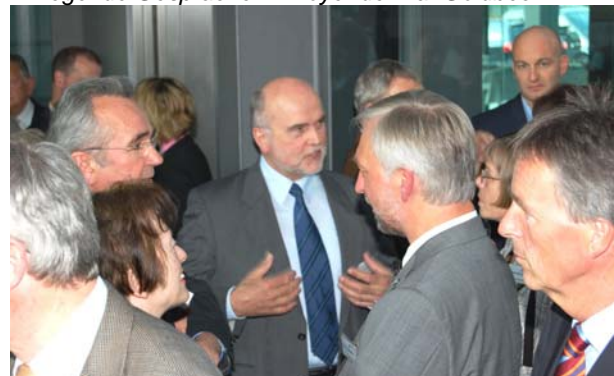
Diskussionen der Hochschulvertreter.