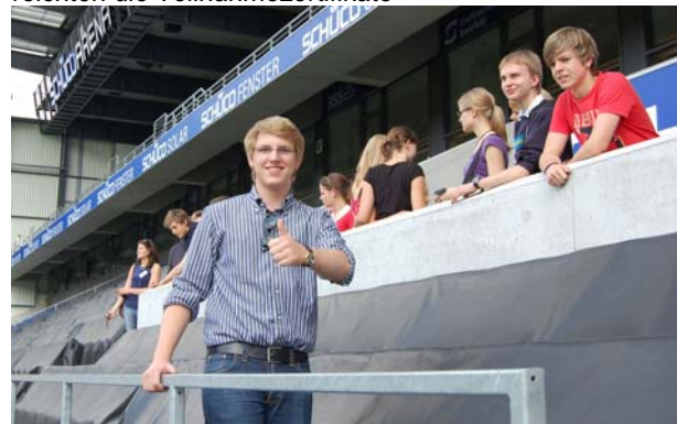
Die Teilnehmer des Economic Summer Camps besichtigen die Schüco – Arena.