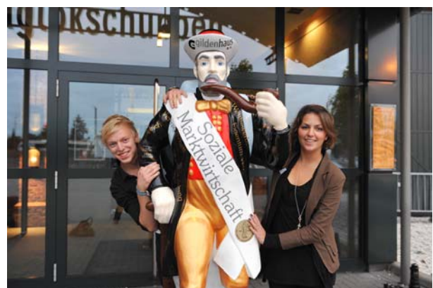
Die Auszubildenden der Fa. Hörmann scheinen die Leineweber-Skulptur auch zu mögen.