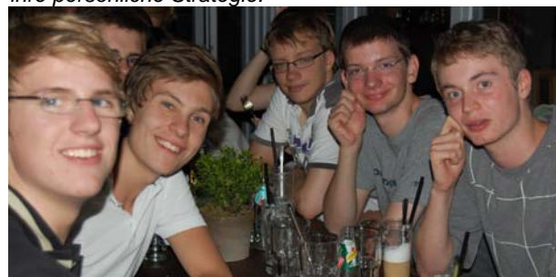
Nach der Kanu-Tour waren besonders die männlichen Jugendlichen sehr zufrieden.