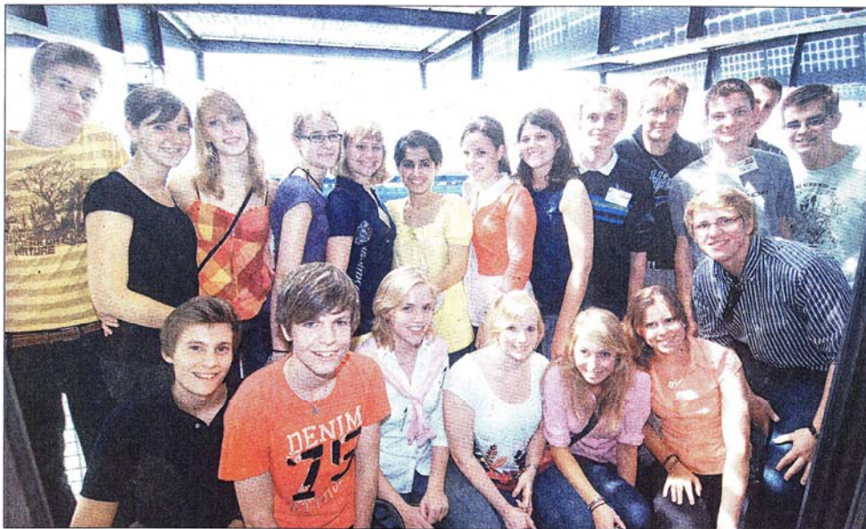
Sonnige Aussichten: Schülerinnen und Schüler aus ganz Ostwestfalen-Lippe hat der Bildungsverein Gildenhaus für sein erstes Sommercamp rund um Wirtschaftsthemen und Karriereplanung ausgesucht. Das Foto der Gruppe, die zusammen wohnt und lernt, entstand in der Schüco-Arena.